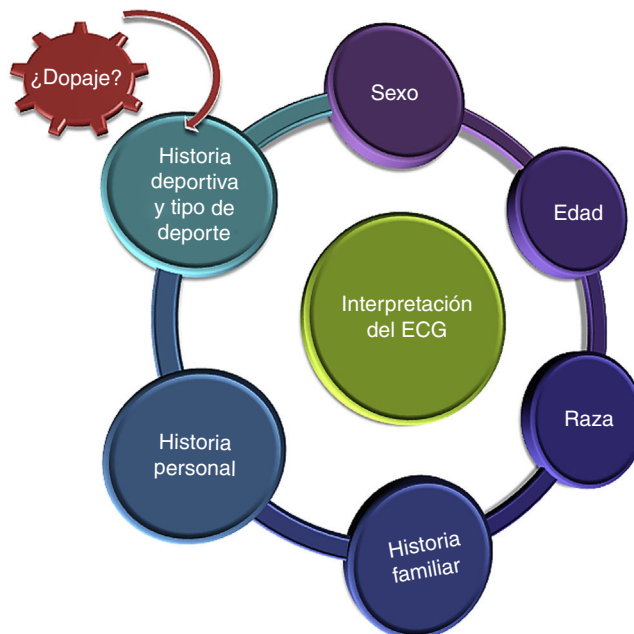
Figura 1. Contexto de interpretación del ECG del deportista. ECG: electrocardiograma.

Una de las innovaciones del documento es la inclusión de consideraciones específicas en la interpretación del ECG de deportistas de 12 a 16 años (patrón juvenil) y de edad \geq 30 , en los que la prevalencia de enfermedad coronaria aumenta considerablemente.